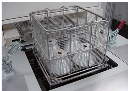
● バスケットを定位置にセット