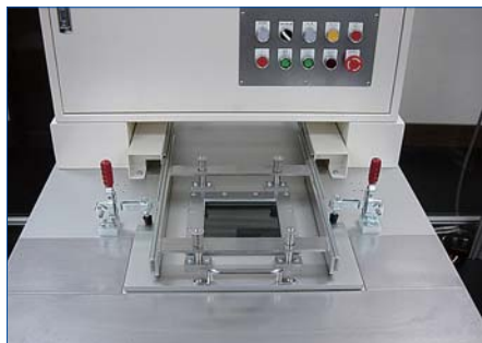
● 開始 ON でバスケットが洗浄槽内に下降し、蓋とクランプを手動で閉じ、洗浄開始